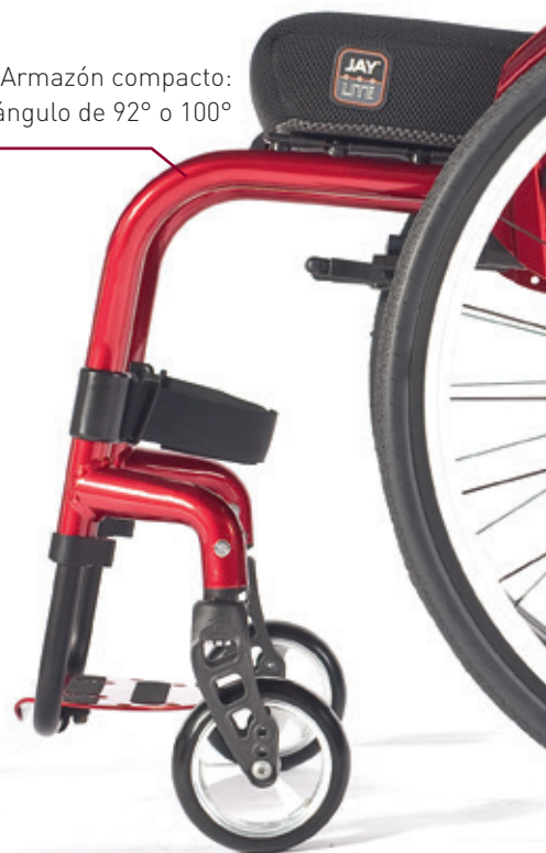
Armazón compacto: ángulo de 92° o 100°

> Diseño innovador del armazón frontal . Moderno y con una gran resistencia.