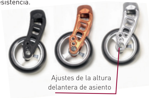
Ajustes de la altura delantera de asiento

La búsqueda de nuevos materiales y tecnologías ha sido clave en el desarrollo de la Argon 2 . El material utilizado en las horquillas es Carbotecture - un material de fibra de carbono extremadamente fuerte y ligero, con una gran resistencia a los impactos. El diseño curvado del tubo de la horquilla se ha conseguido mediante la técnica del Hydroforming , que permite obtener geometrías complejas del tubo con la mayor resistencia.