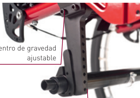
Ajustes de la altura de asiento trasera y del ángulo de asiento