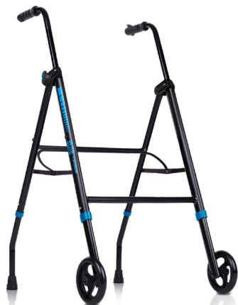
elite 1G IM BY TOTALCARE

Los andadores Elite están diseñados con un sistema de fácil plegado para un cómodo transporte y pensado para ahorrar espacio a la hora de guardarlo en interiores.