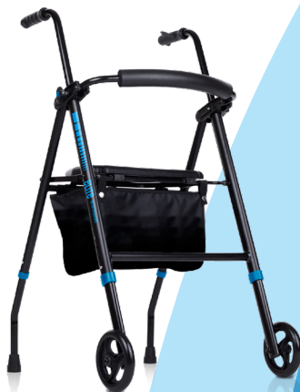
elite 3G IM BY TOTALCARE