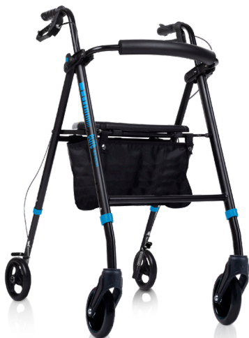
elite FM IM BY TOTALCARE