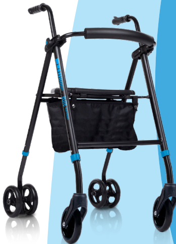
elite FP IM BY TOTALCARE